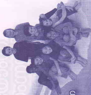
സംയോജിത ശിശുസംരക്ഷണ പദ്ധതി

ബാലാവകാശത്തിനും സംരക്ഷണത്തിനുമായുള്ള സന്നദ്ധ സംഘടനകളുടേയും സ്ഥാപനങ്ങളുടേയും സേവനദാതാക്കളുടേയും പ്രവർത്തനങ്ങളെ ഏകോപിപ്പി